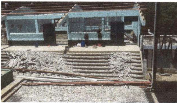
Foto 3: Canales en mal estado, quebrados e incompletos. Modulo 3.