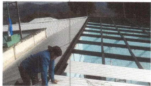
Foto 6: Techo en mal estado, lamina oxidada, quebrada y entra el agua cuando llueve. Modulo 1

Observación: Si es necesario se pueden agregar hojas adicionales y actualizar el número de hojas.