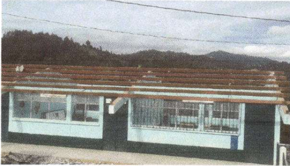
Foto 1: Techo en mal estado, laminas quebradas y entra el agua. Modulo 3