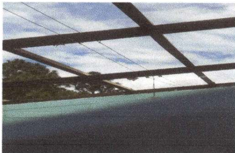
Foto 5: Estructura de madera en mal estado y laminas rotas. Modulo 1